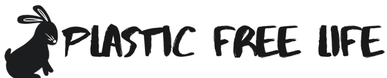
Лого на магазина.

средства, с която идват опаковани продуктите от чужбина – или по такъв начин, че рециклирането накрая да бъде напълно възможно.