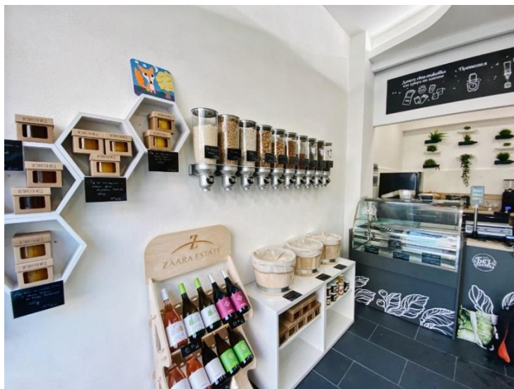
Вътрешността на магазина.

Концепцията на магазина е следната: качествени хранителни продукти, произведени в България без излишни пластмасови и други опаковки.