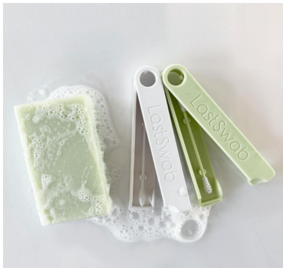
Многократни клечки за уши или за оформяне на грим.

Примерни за продукти и услуги, които се предлагат, са: