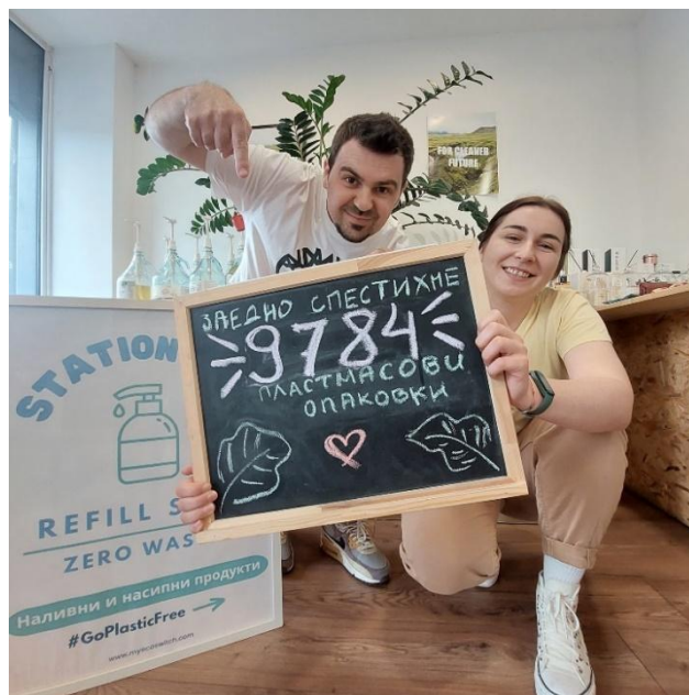
Собствениците на Station Zero.

От магазина се стремят към драстично намаляване на пластмасата в корпоративната среда. Оползотворяването на този потенциал може да спести разходи, а също така и да допринесе за повишаването на ангажираността служителите.